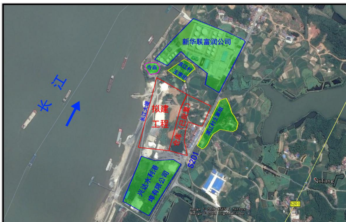
图 3.5-1 区域环境保护目标图