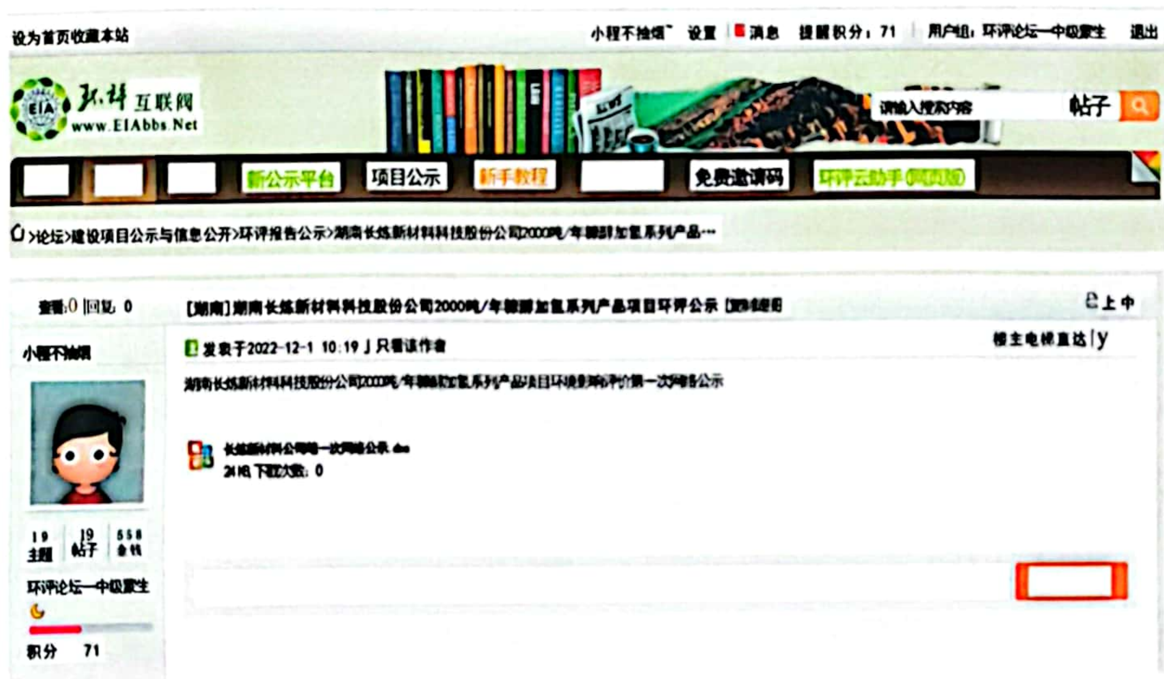
图 1 第一次环境影响评价网站公示截图照片