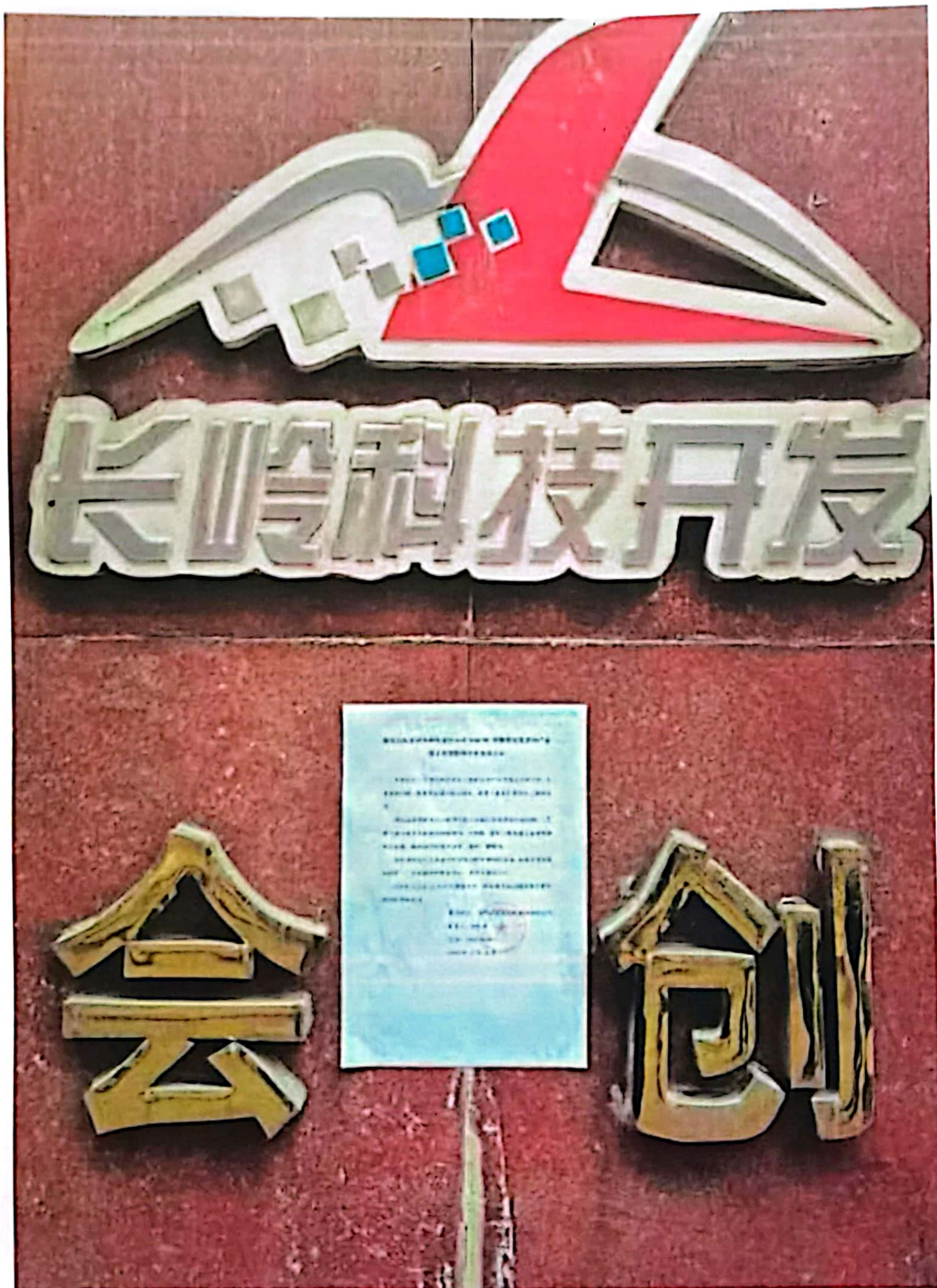
图4 项目现场公示照片