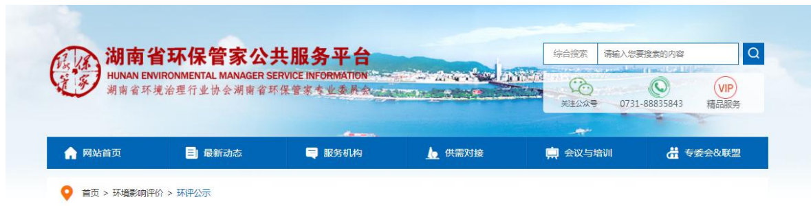
图 3-1 项目第一次网上公告