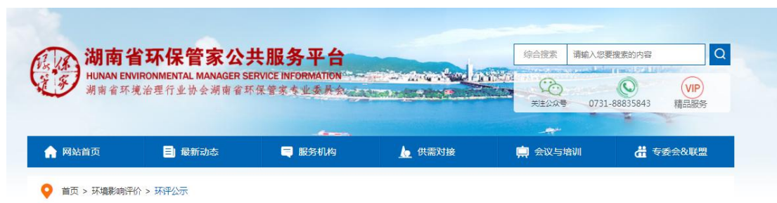
图 6-1 项目报批前网上公告