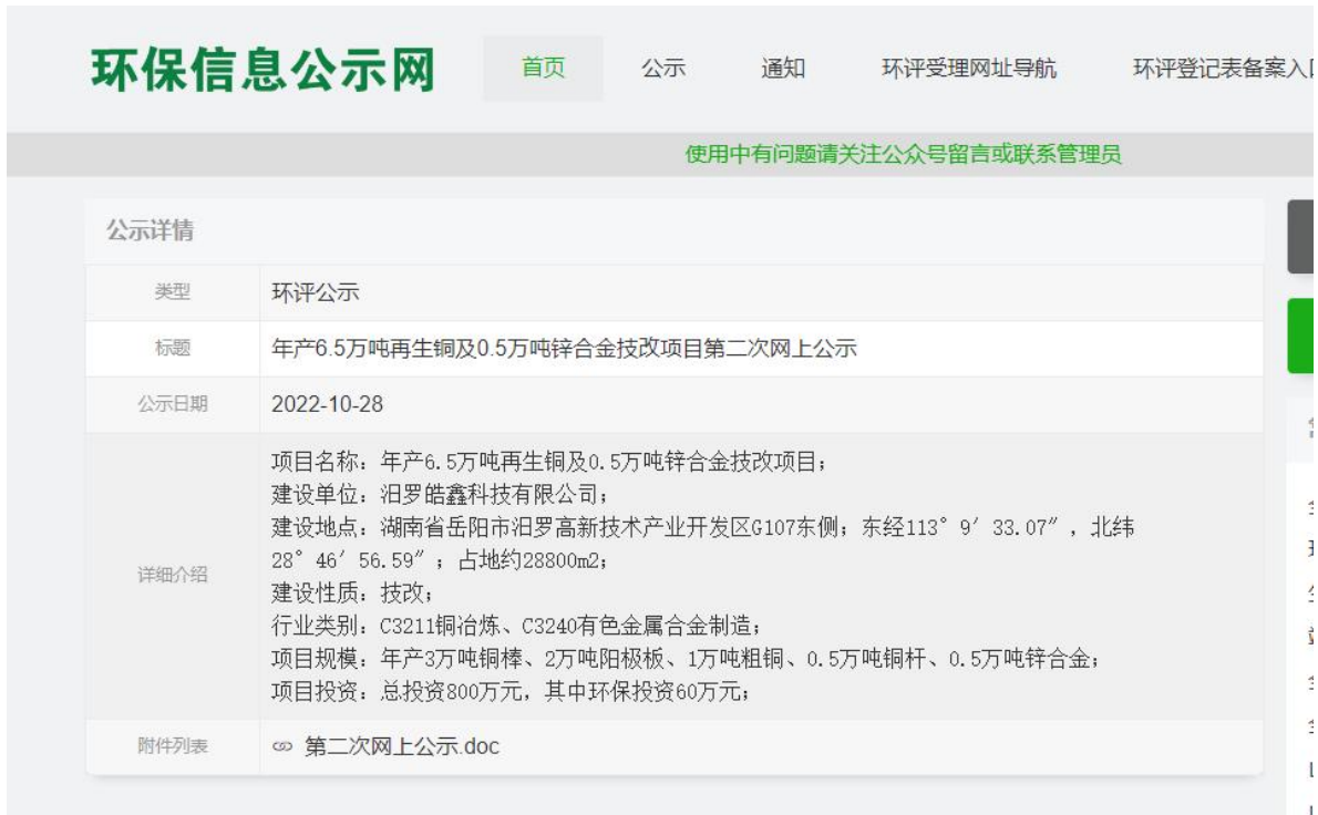
图 2 征求意见稿网上公示截图