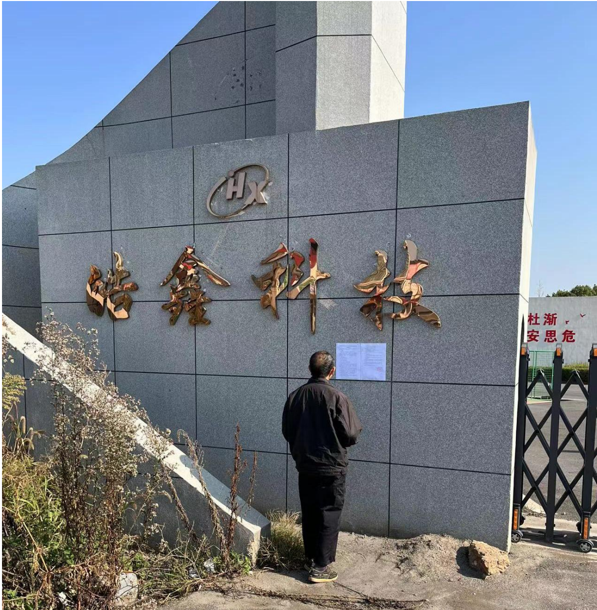
图 4 项目现场公示照片