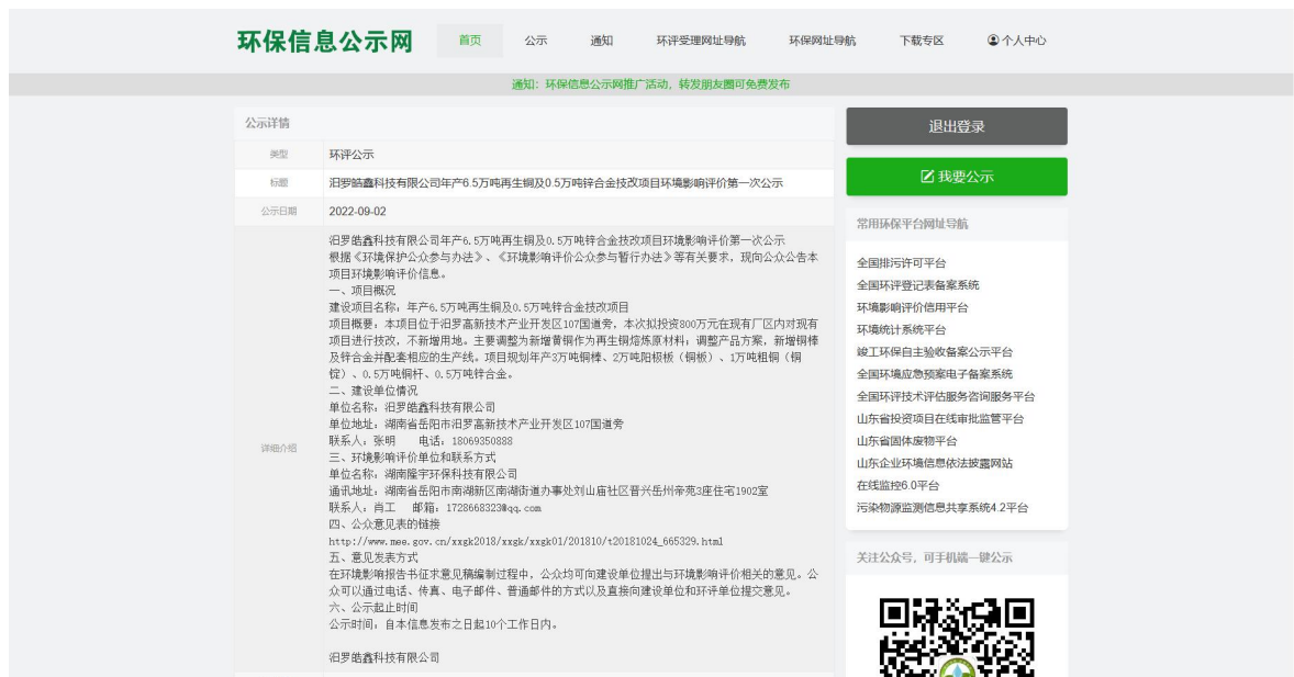
图1 首次环境影响评价网站公示截图照片