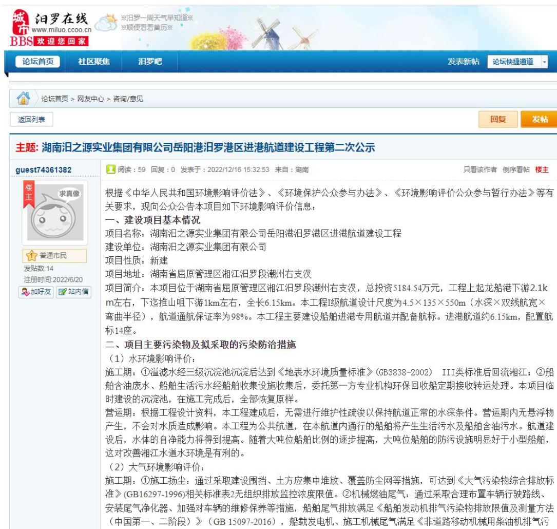
图2 征求意见稿网上公示截图