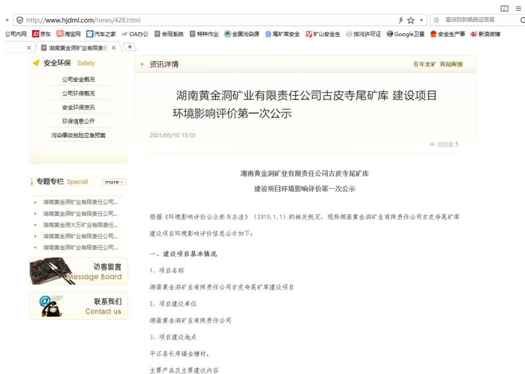
图 1 第一次公众参与网络公示照片

第一次公示采取网络公示的形式，在湖南黄金公司网站上（ http://www.hjdmi.com/news/428.html ）发布本项目环境信息第一次公示，第一次公示照片见图 1。