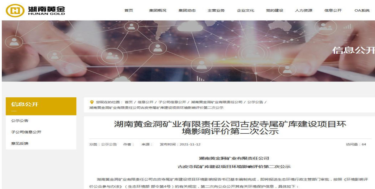
图2 公众参与第二次公示照片

根据环保部相关文件，我单位于 2021 年 11 月 12 日在湖南黄金公司（ http://www.hn-au.com/news/426.html ）上进行了网站公示，网站为开放式网站，配合报纸公示及张贴公示可以实现向居民公示项目情况及报告书全文的目的，详见图 2。