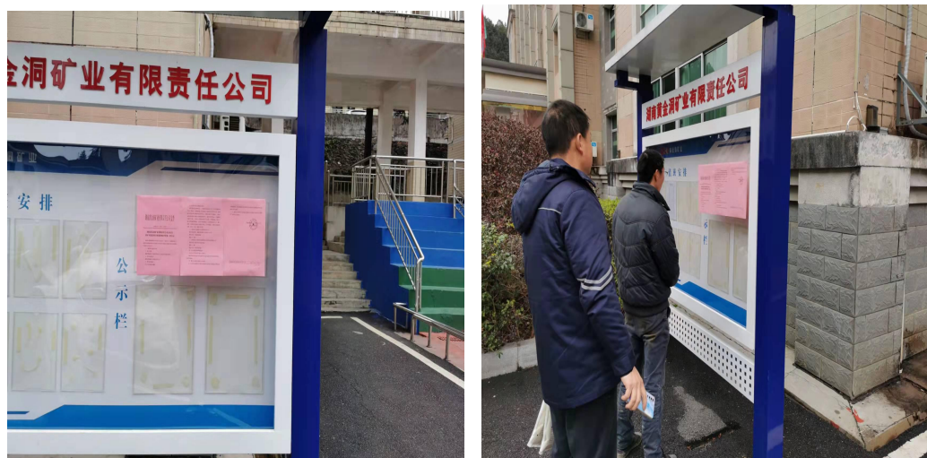
图 5 现场公示照片

我单位于 2021 年 11 月 17 日对项目情况进行了张贴公告，详见图 5。