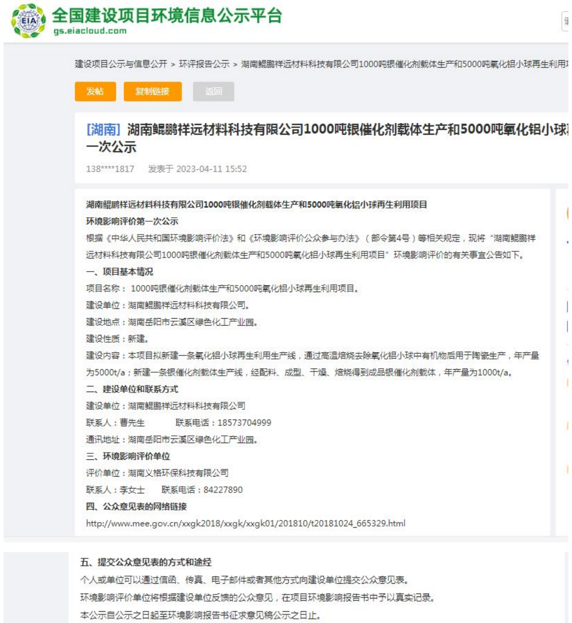
图 1 首次环境影响评价信息公开网站截图