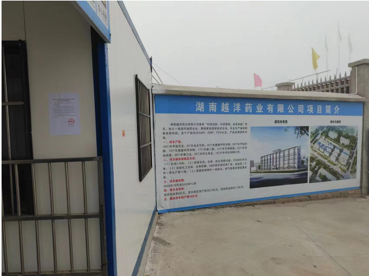
图 4 项目现场公示照片