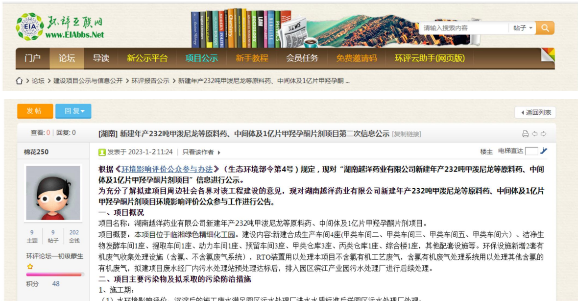
图 2 第二次环境影响评价网站公示截图照片