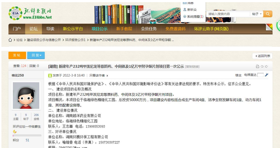
图 1 第一次环境影响评价网站公示截图照片