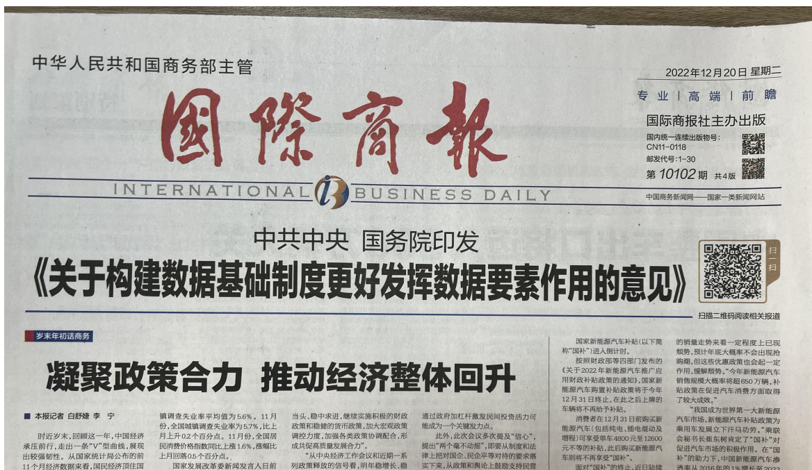
图 3-2 项目报纸上公示图片（第二次）