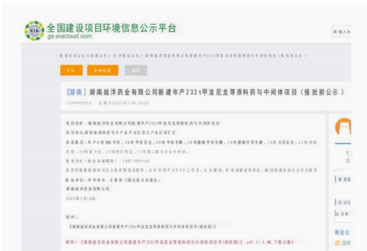
图 5 环境影响报告书报批前公示-网站公示截图