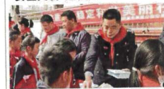
民警向学生进行法治宣传

本报讯(通讯员 李娅 记者 殷佳)普法活动,安全课堂……连日来,岳阳楼公安分局积极组织“法治第一课”活动,多警联动,警地联合,广设宣传毒品防范、预防电信诈骗、拒绝欺凌等安全知识,让丰富多彩的“安全大餐”走进校园,让“警营开放”为师生们带来最真切的安全感。