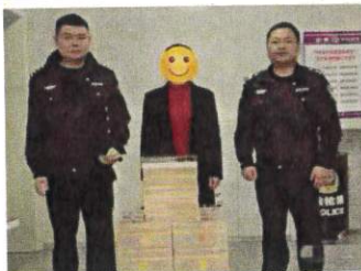
岳东派出所将追回赃物送还给受害群众

3月以来,岳阳市公安局岳东分局大力开展了学雷锋活动,用实际行动践行新时代雷锋精神。