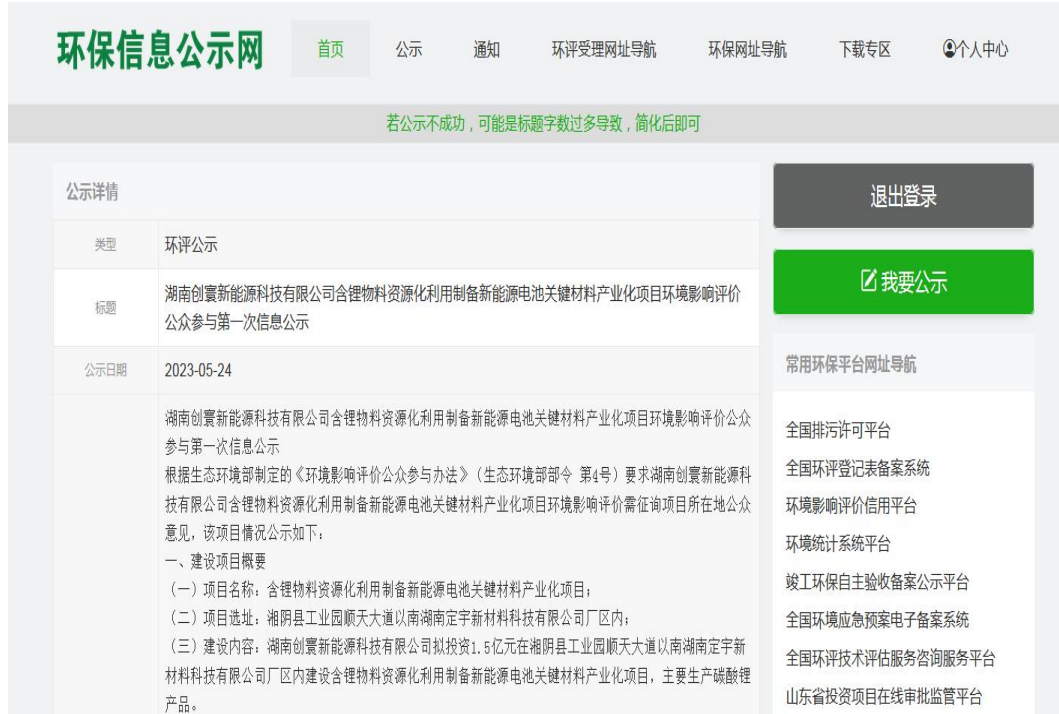
图 1 首次环境影响评价信息公开网络公示截图

响报告书编制单位的名称、公众意见表的网络链接以及提交公众意见表的方式和途径等内容。公示时间及内容符合《环境影响评价公众参与办法》的要求。公示截图详见图 1。