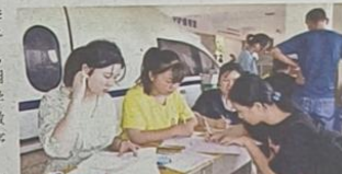
新生入学报到

本报讯(记者 黄诚成 通讯员 李四毛) 8月17日早上,岳阳市湘北女子职业学校2023级新生报到的第一天,陆续有学生在家长的陪同下进入校园等待报名。该校100多名迎新老师和学生助理应接不暇,新生编班、编寝、缴费、充卡、领取生活用品等,忙碌有序地进行。