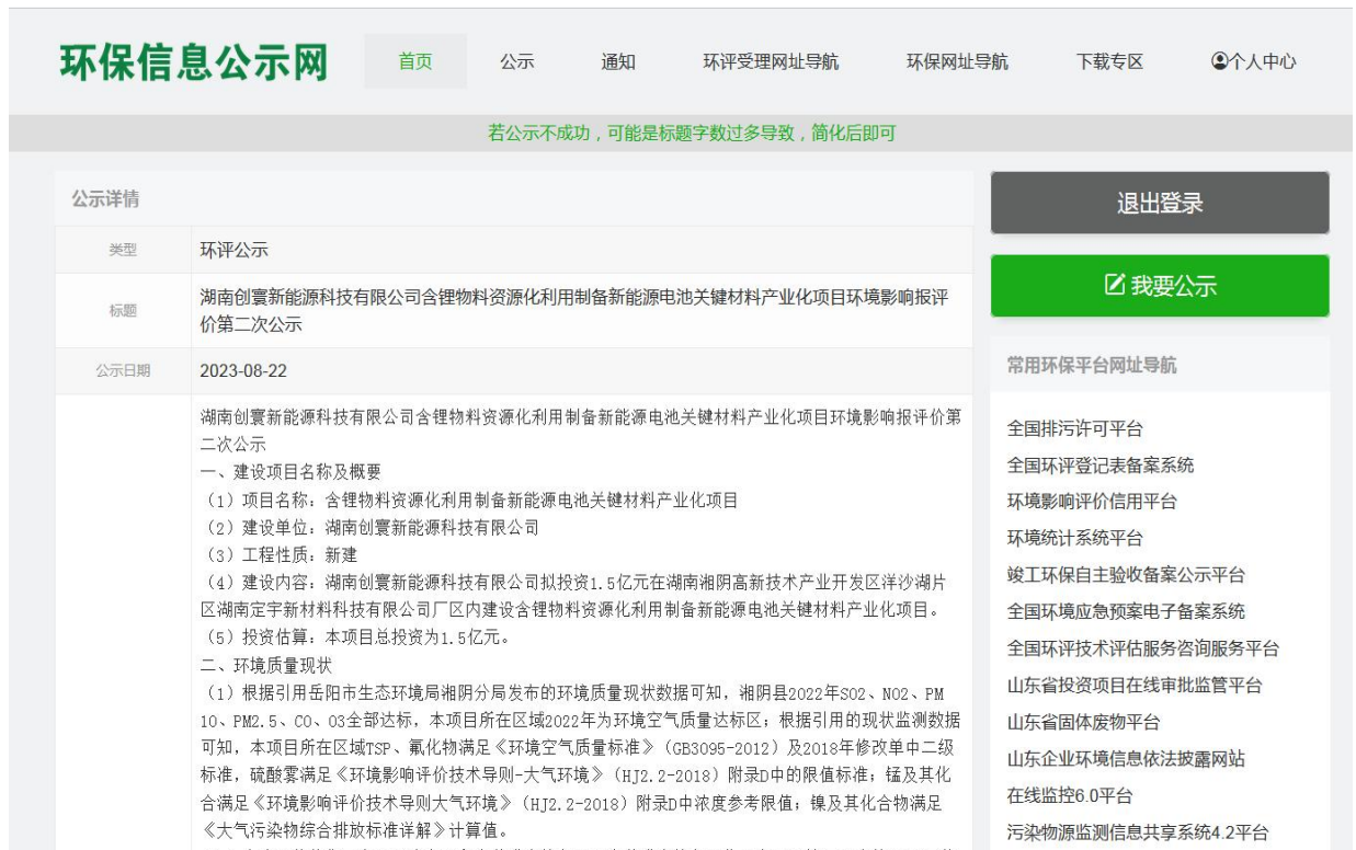
图 2 网络第二次公示截图

网络公示链接地址：环保信息公示网（公示链接地址： https://www.huanbao58.com/detail.php?itemid=1329 ）。公示截图如下：