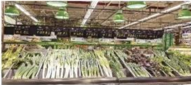
“生鲜灯”亮下的蔬菜新鲜诱人

重庆菜市场的消费者,可能会经常遇到这样一个现象,几乎每个摊位都使用了各种颜色的“生鲜灯”,在灯光的照射下,猪肉、蔬菜等显得特别新鲜,但买回家后发现,它们仿佛“变了味”——肉类颜色发灰,蔬菜干瘪无光。