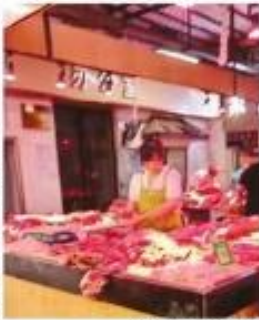
“生鲜灯”亮下的鲜肉