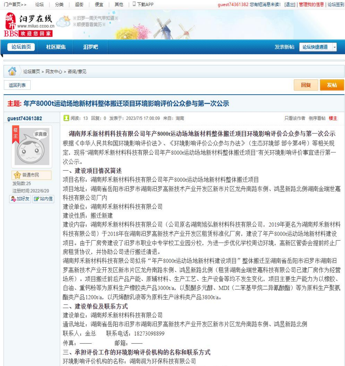
图1 第一次网络公示图片