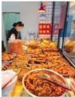
“生鲜灯”亮下的熟食诱人

一位以卖水果经营为主的店主告诉记者,她开店十几年,一直使用的普通照明灯,以不使用“生鲜灯”,她知道“生鲜灯”的“打光美颜”效果好,但是自己卖的是熟客生意,不会刻意追求水果卖相,对于品相较差或者不太新鲜的的水果,她会作特价处理,对于“生鲜灯”照得叫厚的情况,她认为这对于消费者是好事,对于他们这些经营者来说,也会起到一种自律作用,诚信经营,赢得顾客。