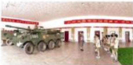
岳阳市岳阳县岳阳县实验小学

“除了课本,历史书是‘掌上明珠’。”岳阳县实验小学的孩子们,在暑假期间参加了研学游活动。在研学游中,孩子们不仅学习了课本知识,还通过实地考察,增长了见识,开阔了眼界。研学游已成为家庭教育的新选择。