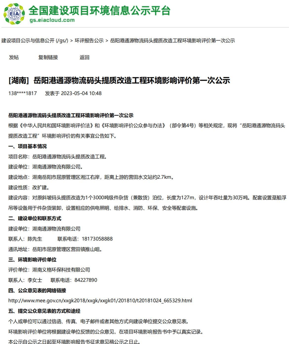
图 1 首次环境影响评价信息公开网站截图