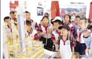
孩子们的参观展厅

安全小课堂，撑起“保护伞”。该中心关工委邀请辖区交警部门、消防保卫中心专业人员，以及蓝天救援队志愿者等，为孩子们和家长进行交通、居家和防溺水安全宣传，通过典型案例剖析安全事故成因和求救知识。