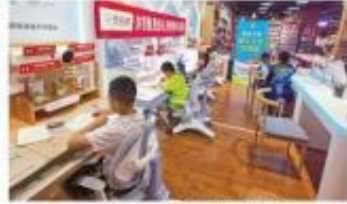
孩子们在托管班自主学习

暑假期间,孩子托管问题成为企业职工特别是双职工家庭的心头大患。日前,湖南省总工会、省妇联受联合下发《关于推进全省2023年湖南省爱心托管服务工作的通知》,鼓励支持用人单位为职工提供托育服务,重点建设好“单位门口”和“家门口”托育机构。