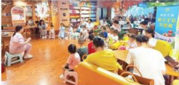
爱心文体中心的职工子女托管班