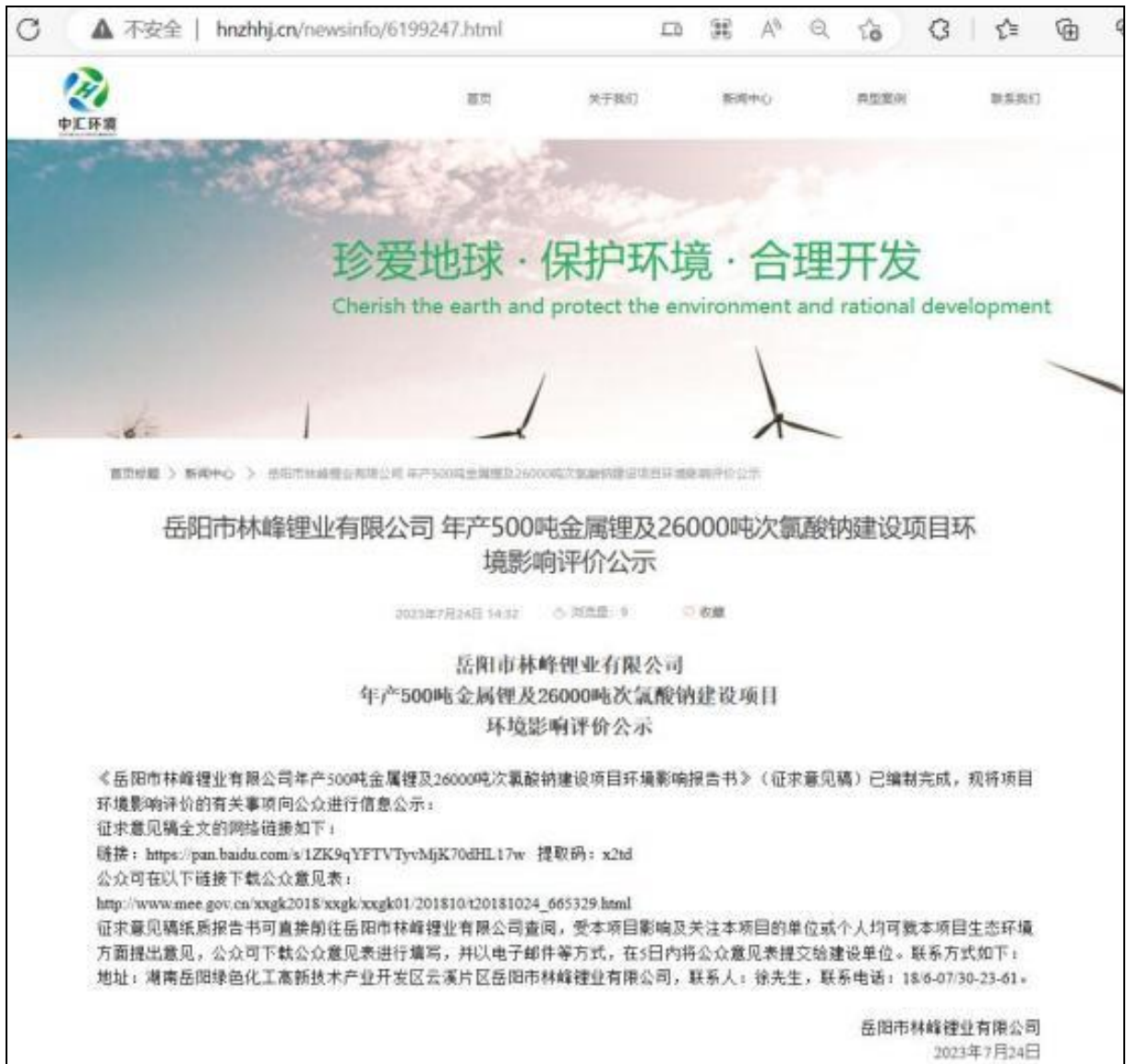
图 2.2-1 征求意见稿公示期间网络公示截图