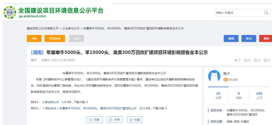
图 5 项目环境影响报告书全本公示截图

依据《环境影响评价公参管理办法》、《建设项目环境影响评价信息管理工作方案》要求，建设单位应当在环境影响报告编制完成后，向环境保护主管部门报批前，向社会公开环境影响报告全本。建设单位于 2023 年 12 月 4 日在全国建设项目环境信息公示平台（ https://www.eiacloud.com/gs/detail/3?id=31204fk782 ）进行了项目环境影响报告书全本公示。公示期间，未收到反馈意见。项目环境影响报告书全本公示截图如下：