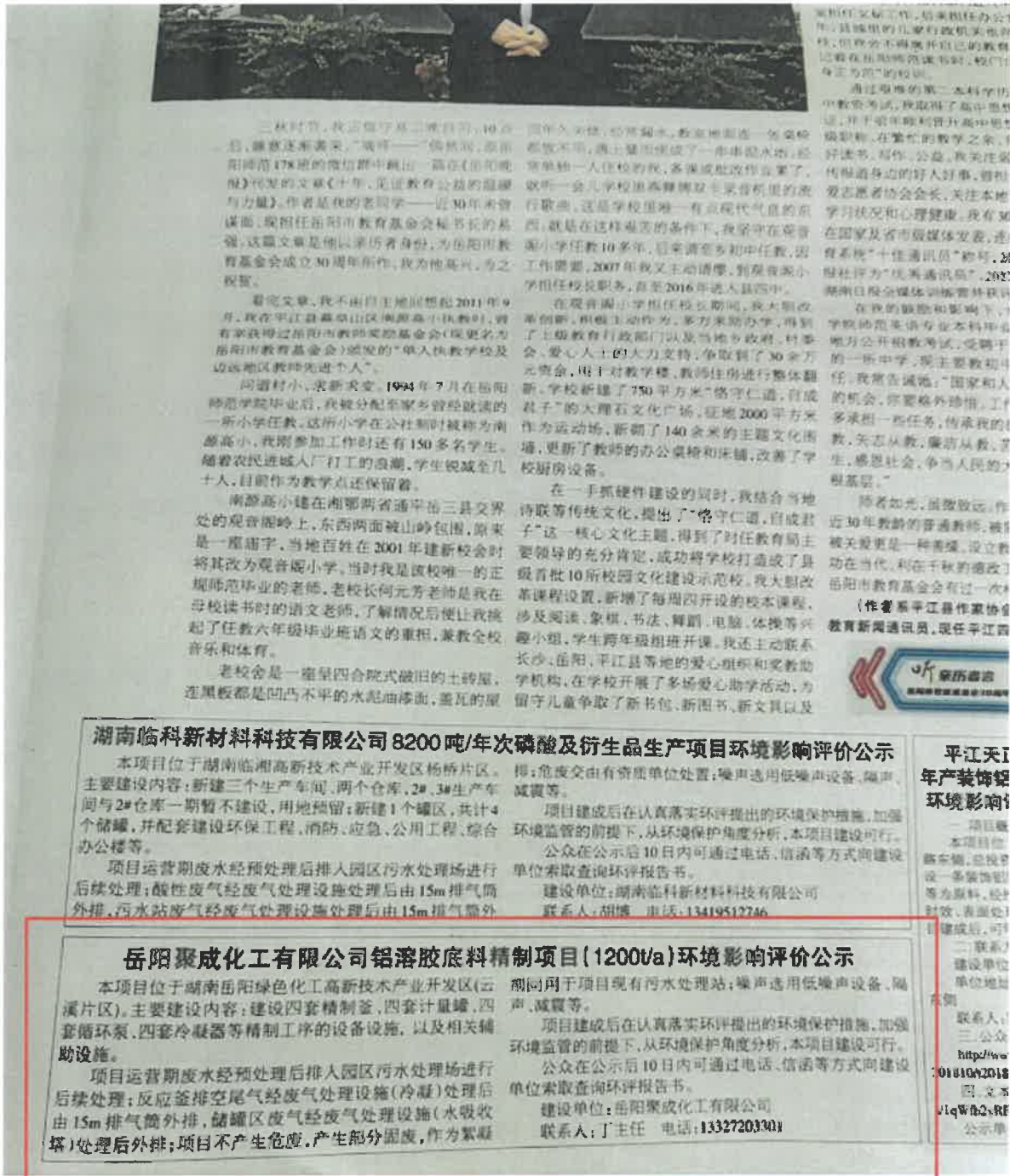
图 3-1 项目报纸上公示图片（第一次）