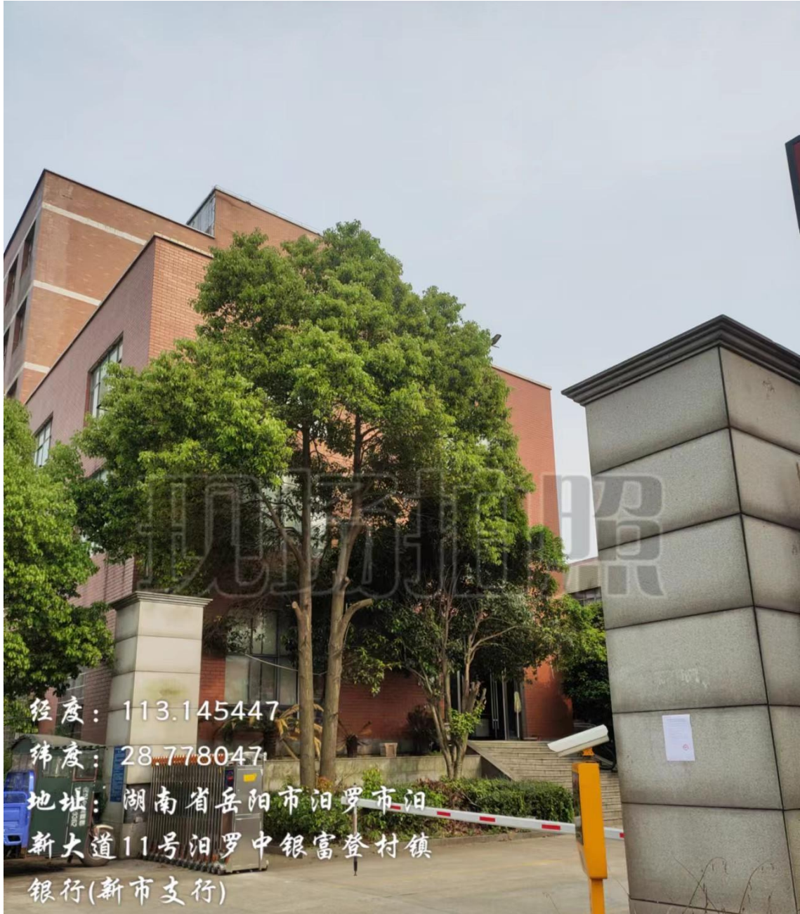
图3 二次现场张贴公示