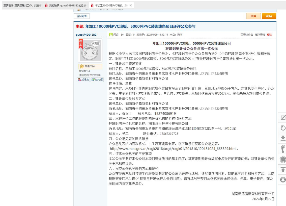
图 1 第一次网络公示图片