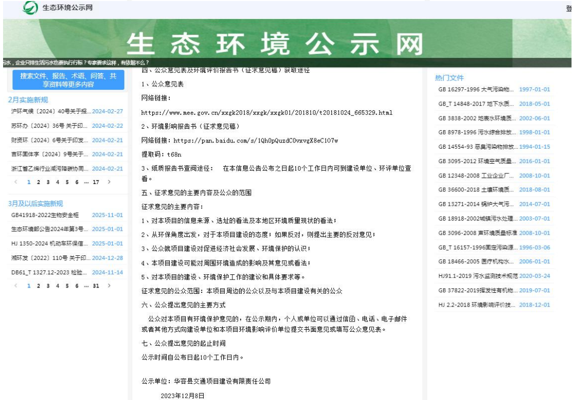
图 2 第二次网络公示截图