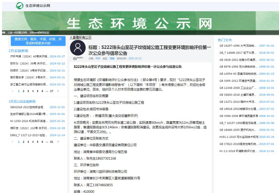
图 1 首次环境信息公示截图