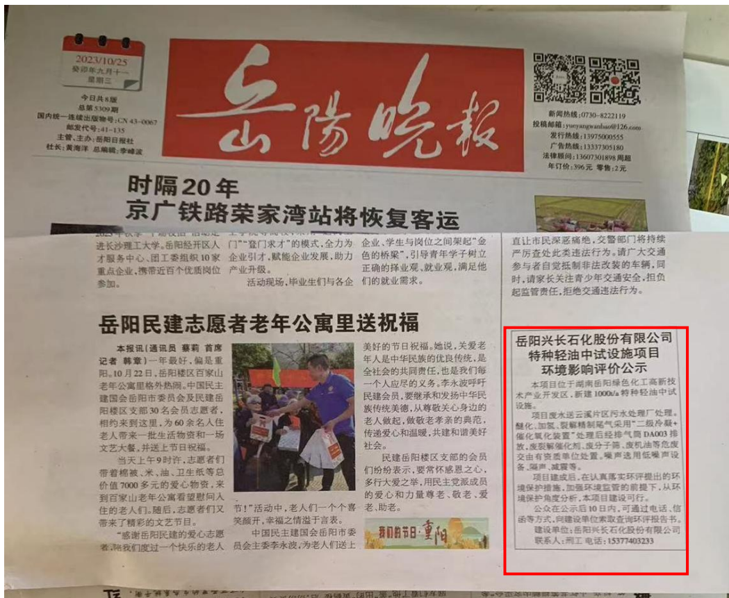
图 3-2 项目报纸上公示图片（第二次）