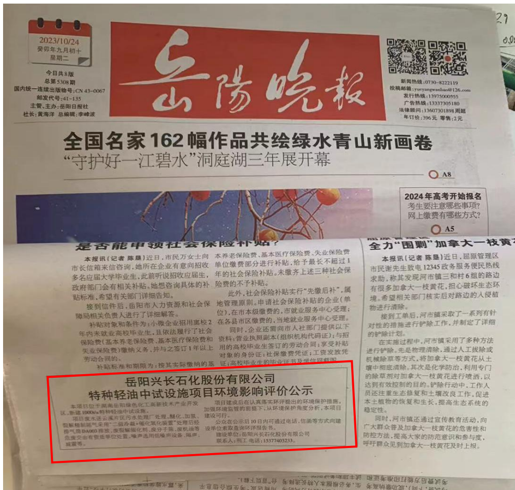
图 3-1 项目报纸上公示图片（第一次）