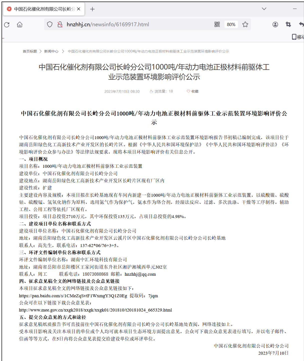
图 2.2-1 项目征求意见稿环境影响评价信息公开网络公示截图