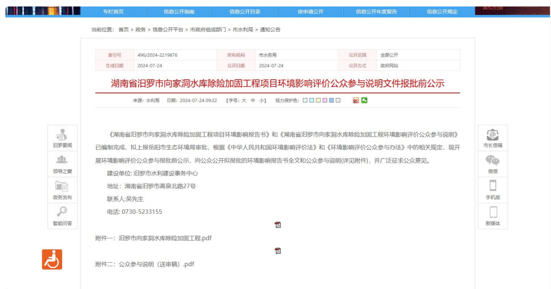
报批前网络公示截图

公参办法第二十条规定：建设单位向生态环境主管部门报批环境影响报告书前，应当通过网络平台，公开拟报批的环境影响报告书全文和公众参与说明。本项目报批前公示，满足《环境影响评价公众参与办法》第二十条的要求。